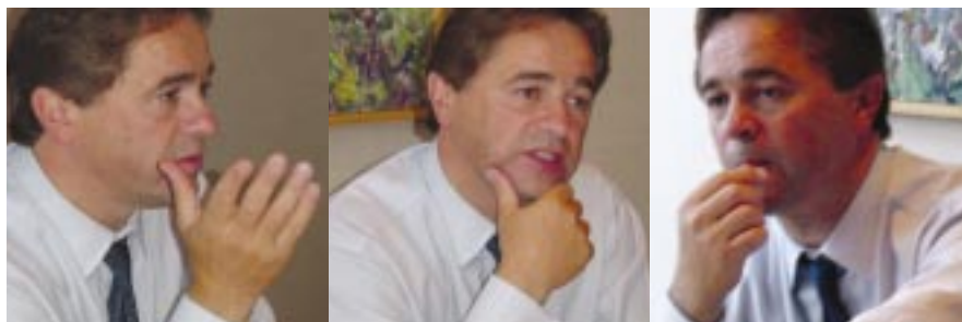
l'Honorable Brian Tobin, ministre de l'Industrie

Le Réseau canadien de l'arthrite (RCA) recevra un montant de 10 928 000 dollars pour la période couvrant les trois prochaines années a annoncé l'Honorable Brian Tobin, ministre de l'Industrie.